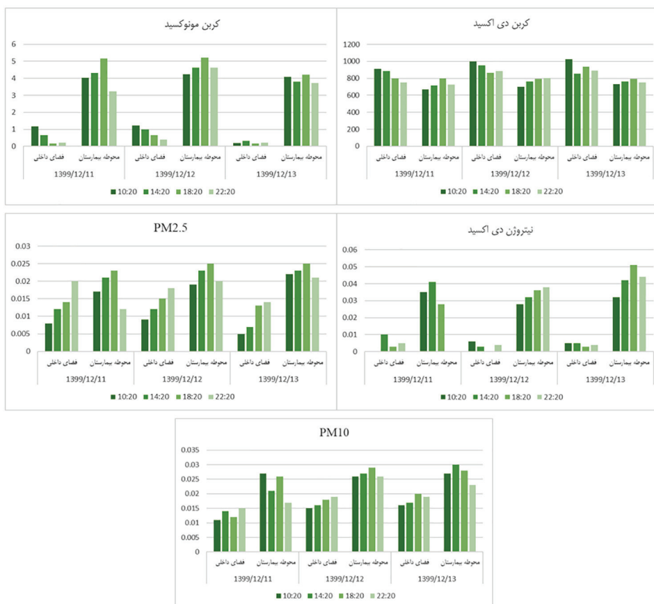
شکل ۲. مقایسه پارامترهای کربن دی اکسید، کربن مونوکسید، نیتروژن دی اکسید و ذرات معلق اندازه گیری شده PM 2.5 و Particular Matter (PM 10 ) در اتاق شماره ۶ بیمارستان نمازی، بخش مراقبت‌های ویژه قلب و محوطه بیمارستان

اجرای استراتژی‌های بازخورد زیست‌محیطی نیز می‌تواند به عنوان یک راهکار جاری برای بهبود کیفیت هوا و کاهش آلودگی‌های محیطی در داخل بیمارستان نمازی مطرح شود. این اقدامات نه تنها به بهبود کیفیت هوای داخلی کمک می‌کنند بلکه نقش بسزایی در حفظ سلامت و آسایش افراد ایفا می‌نمایند (۴۱-۴۳).