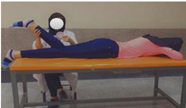
شکل ۲. نحوه اندازه‌گیری حس عمقی به وسیله اینکلاینومتر

اندازه‌گیری حس عمقی مفصل زانوی آزمودنی‌ها توسط اینکلاینومتر انجام شد. حس وضعیت مفصل زانوی پای غالب این ورزشکاران از طریق بازسازی زاویه ۵۰ درجه با چشم بسته (برای جلوگیری از ارسال پیام‌های بینایی به سیستم عصبی مرکزی) در زنجیره حرکتی بسته به‌طور فعال ارزیابی شد (۱۸). برای این منظور، فرد به صورت دمر روی میز معاینه دراز کشید و اینکلاینومتر روی عضله دوقلو قرار گرفت. با گرفتن پاشنه پا و با حرکت پاسیو و سرعت تقریبی ۱۰ درجه در ثانیه، بدون اینکه تغییری در وضعیت مچ پا ایجاد شود زانو به زاویه ۵۰ درجه فلکشن برده شد و از آزمودنی خواسته شد تا زاویه موردنظر را پنج ثانیه نگه دارد و روی آن تمرکز کند. سپس زانو به وضعیت استراحت برگردانده می‌شد و محقق بعد از هفت ثانیه از فرد درخواست می‌کرد که یک بار به صورت غیرفعال و یک بار به صورت فعال تا ساق پا را حرکت دهد و زاویه تست شده را با سرعت دلخواه بازسازی کند (۱۹). اختلاف زاویه آزمون و زاویه بازسازی به‌عنوان خطای مطلق در نظر گرفته می‌شد. منظور از خطای مطلق، میزان انحراف از زاویه هدف در بازسازی زاویه‌ای حرکت بدون احتساب